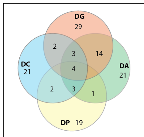
Graphique 2 : Diagramme de la combinatoire des postes de direction

Légende : DG : Direction générale. DA : Direction artistique. DC : Direction des communications. DP : Direction de la production.